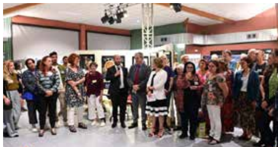
Vernissage en présence de Loïc HERVE, Sénateur

Rendez-vous le 1 er week-end d'octobre 2024 pour découvrir de nouveaux talents.