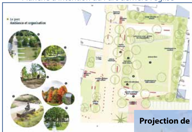
Planche d'intention du Parc derrière l'église

Pour ceux qui n'ont pu être présents ce jour-là, n'hésitez pas, le projet est consultable en mairie !